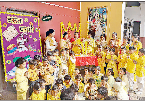
झज्जर। मां सरस्वती को नमन करते हुए शिक्षक एवं विद्यार्थी।