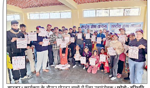
झज्जर। कार्यक्रम के दौरान पोस्टर हाथों में लिए स्वयंसेवक।