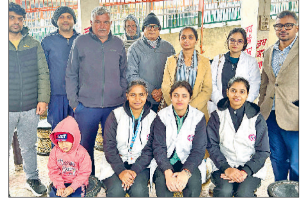
बहादुरगढ़। ग्रामीणों के साथ अस्पताल की टीम।