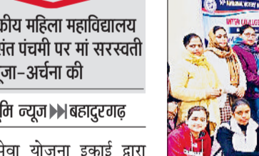
बहादुरगढ़। कार्यक्रम में शिक्षकों के साथ छात्राएं।

राष्ट्रीय सेवा योजना इकाई द्वारा राजकीय महिला महाविद्यालय परिसर में नशा मुक्ति अभियान विषय पर एक दिवसीय शिविर का आयोजन किया गया। शिविर का उद्देश्य छात्राओं में नशे के दुष्प्रभावों के प्रति जागरूकता फैलाना तथा समाज को स्वस्थ, सशक्त और नशामुक्त बनाने का संदेश देना था। कार्यक्रम का शुभारंभ बसंत पंचमी के पावन अवसर पर मां सरस्वती की पूजा-अर्चना से किया गया। सभी स्वयं सेविकाओं व शिक्षकों ने विद्या, सद्बुद्धि और