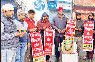
झज्जर। नेताजी सुभाष चंद्र की प्रतिमा पर माल्यार्पण के उपरत एकत्रित किसान एवं मजदूर संघ के प्रतिनिधि एवं अन्य।