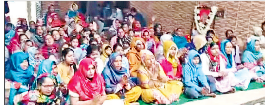
झज्जर। कीर्तन में उपस्थित महिला श्रद्धालु।