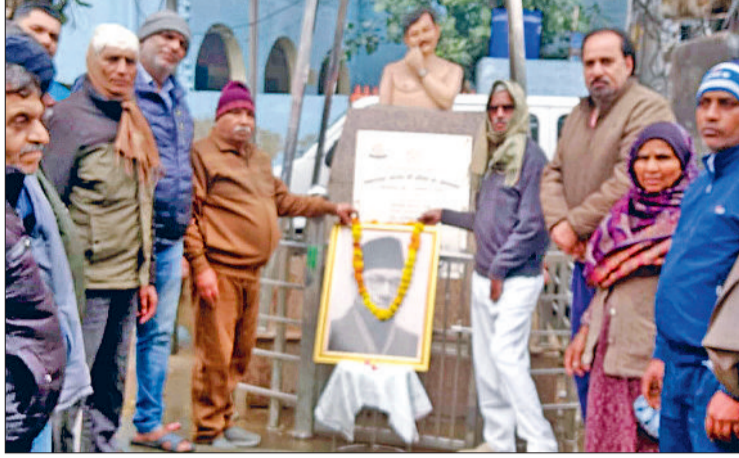
बहादुरगढ़। नेताजी को नमन करते मंच के सदस्य व लाइनपारवासी।

वक्ताओं ने कहा कि नेताजी जिस आजादी का सपना लेकर लड़े, उसका वास्तविक लाभ आज भी आम गरीब जनता तक नहीं पहुंच पाया। युवा वर्ग भीषण बेरोजगारी से जूझ रहा